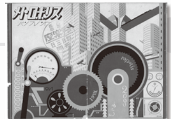
当時のパンフレット

ある日、メトロポリスを支配する権力者の息子フレード(グスタフ・フレーリッヒ)は、労働者階級の娘マリア(ブリギッテ・ヘルム)と出逢ったことにより、地下の過酷な環境を知ること。マリアは階級社会の実体を訴え、このことがきっかけとなってストライキの気運が生じる。危機感を抱いたフレードの父である権力者のヨハン・フレードゼン(アルフレート・アベル)は、発明家のロトワング(ルドルフ・クライン＝ロッケ)を使いマリアを監禁し、マリアそっくりのアンドロイドを作って地下社会へ送り込み、事態を収めようとするのだったが、アンドロイドは狂い始め、労働者達を扇動し始めるのだった…。